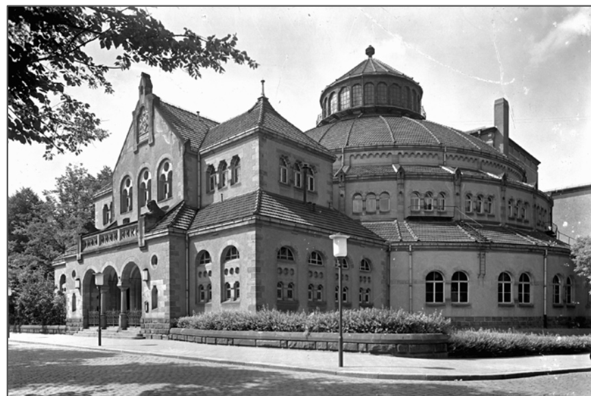
Städtisches Spiel- und Festhaus, August 1939