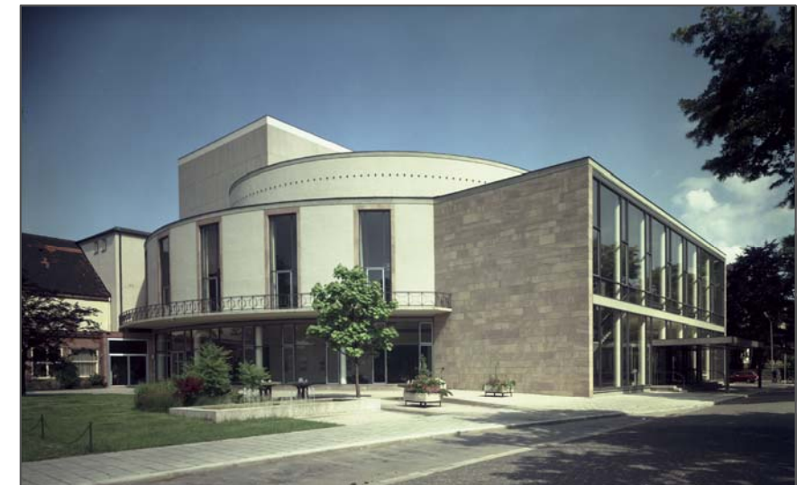
Spiel- und Festhaus, Juni 1968