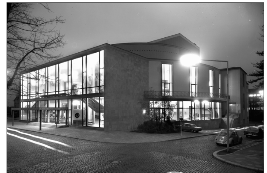
Spiel- und Festhaus mit Nachtbeleuchtung, November 1967