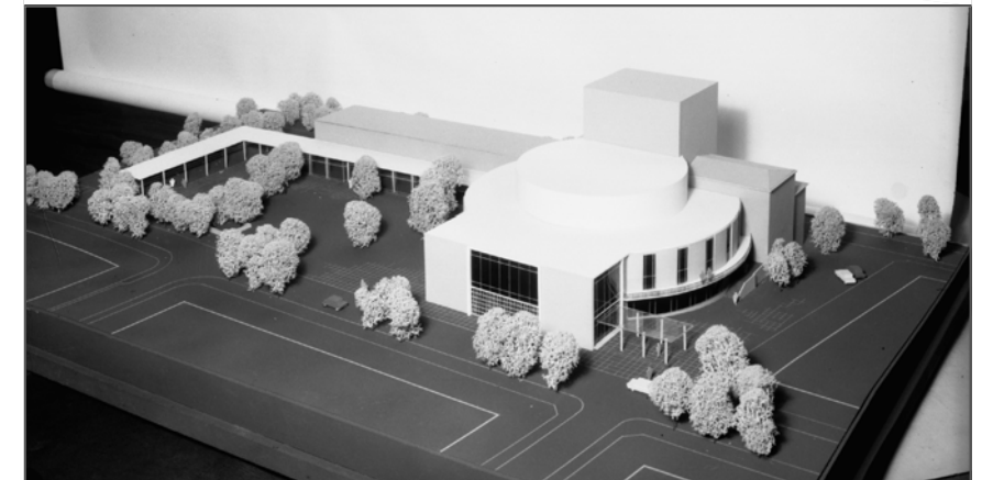
Spiel- und Festhaus Modell, März 1961