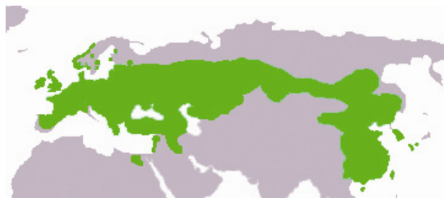
Verbreitung der Saatkrähe

Die Saatkrähe ist in Teilen Europas und Asiens verbreitet. In Deutschland sind die osteuropäischen Saatkrähen häufige Wintergäste.