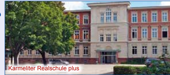
Karmeliter Realschule plus