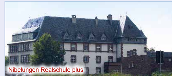
Nibelungen Realschule plus