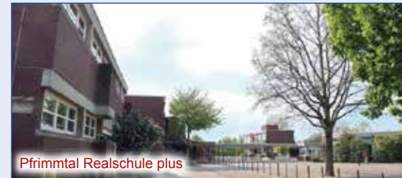
Pfimmtal Realschule plus