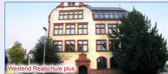
Westend Realschule plus