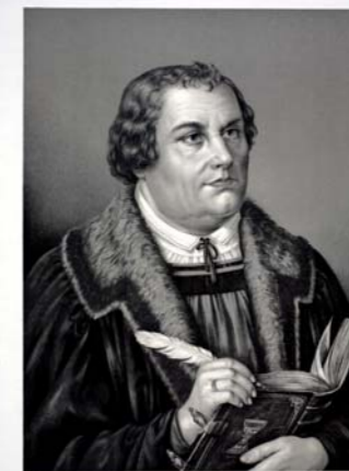
DR. MARTIN LUTHER.

Martin Luther n'a séjourné que dix jours à Worms, mais ces dix jours ont profondément changé le monde. Le moine augustin de Wittenberg, déjà excommunié depuis janvier 1521, fut convoqué par Charles Quint comme fauteur de troubles et mis au ban du Saint Empire par la Diète de Worms. Avec ses revendications de retour aux sources originelles de la foi chrétienne, il disait tout haut ce que nombre de ses contemporains pensaient tout bas. Ses écrits étaient toutefois considérés par ses adversaires comme une provocation très claire contre Rome, mais aussi comme une rébellion contre ses supérieurs. Il devait maintenant prendre des distances avec ce qu'il avait écrit. Luther demanda un temps de réflexion, puis refusa tout compromis. Comme il ne pouvait être contredit par les Saintes Ecritures sur lesquelles il s'appuyait, il ne voulait ni ne pouvait rien rétracter « Parce qu'il n'est ni sûr ni innocent d'agir contre sa conscience ».