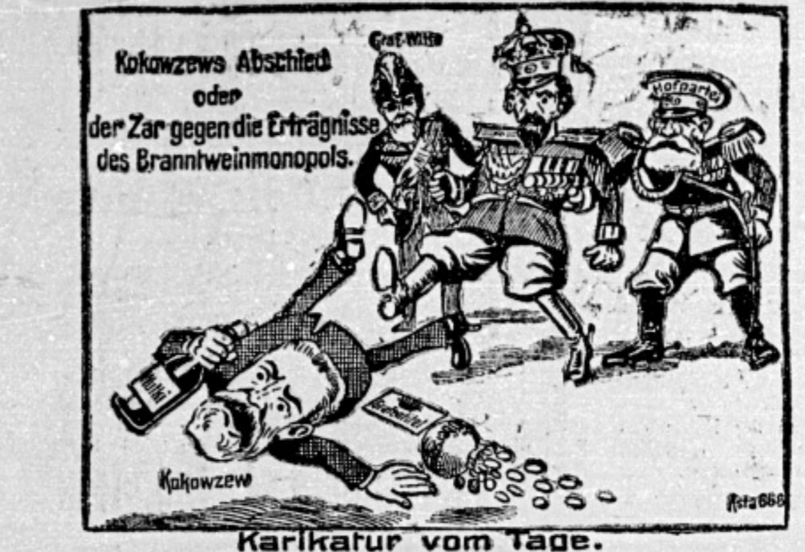
Karikatur vom Tage.