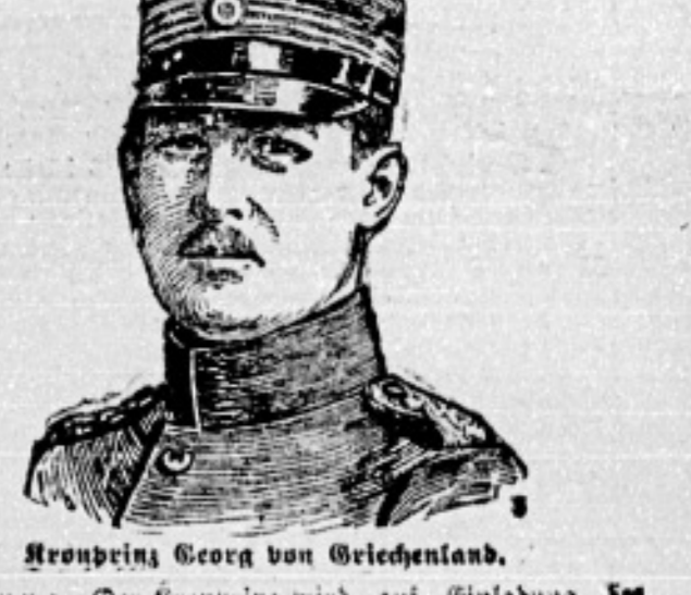
King George of Greece.

Berliner Theaterkritik. Der neue „Holl“ Das in Worms am Sonntagabend erstmalig aufgeführte neue Schauspiel des Wiener Dramatikers, Leo Fall's „Holl“ ist ein sehr interessantes Stück. Die Handlung ist in der Zeitung veröffentlicht. Die politische Lage wird in der Zeitung ausführlich behandelt. Die Nachrichten sind in der Zeitung veröffentlicht.