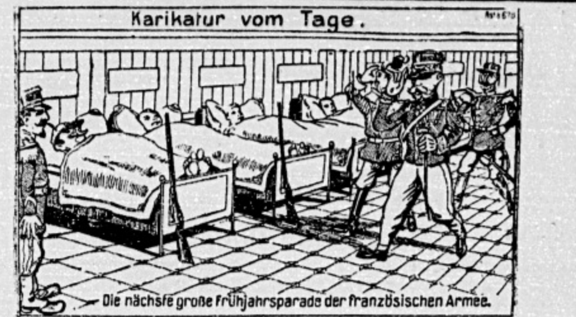
Die nächste große Frühjahrsparade der Französischen Armee.