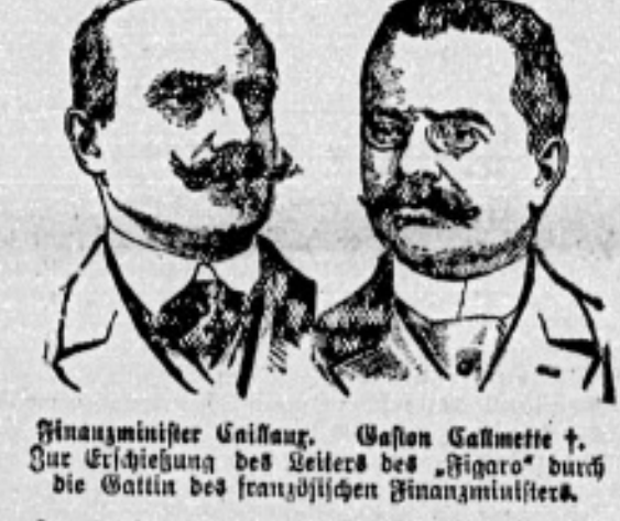
Portrait of a man, likely a political figure mentioned in the text.

Worms, 18. März. Worms, 18. März. Worms, 18. März.