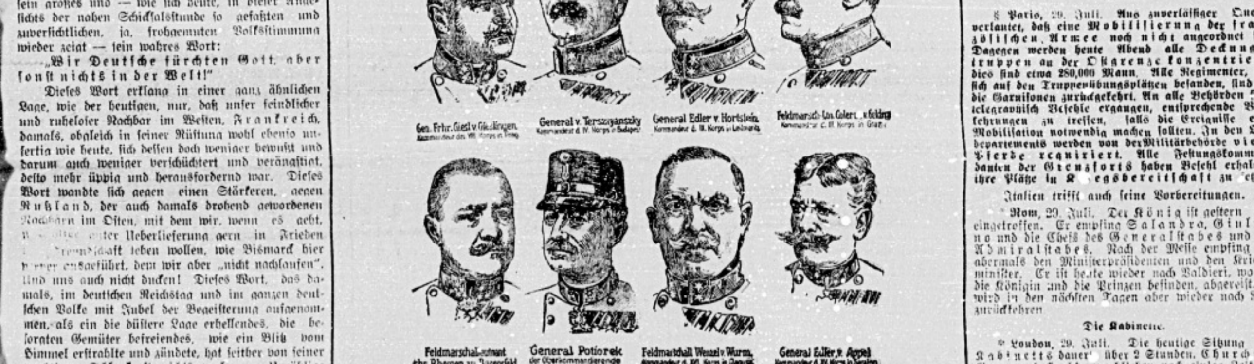
Die Führer der österreichisch-ungarischen Armee.