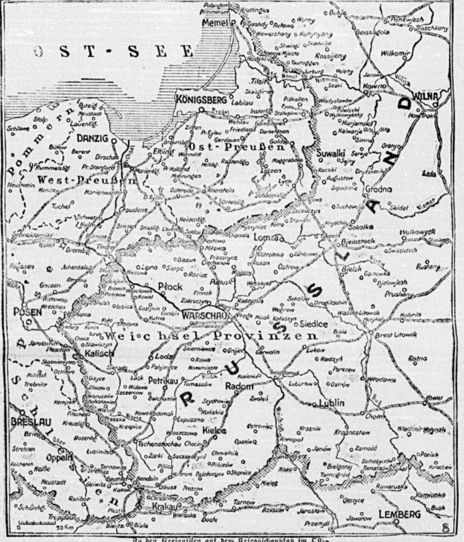
Die Grenzlinien am dem Kriegsausbruch im Osten