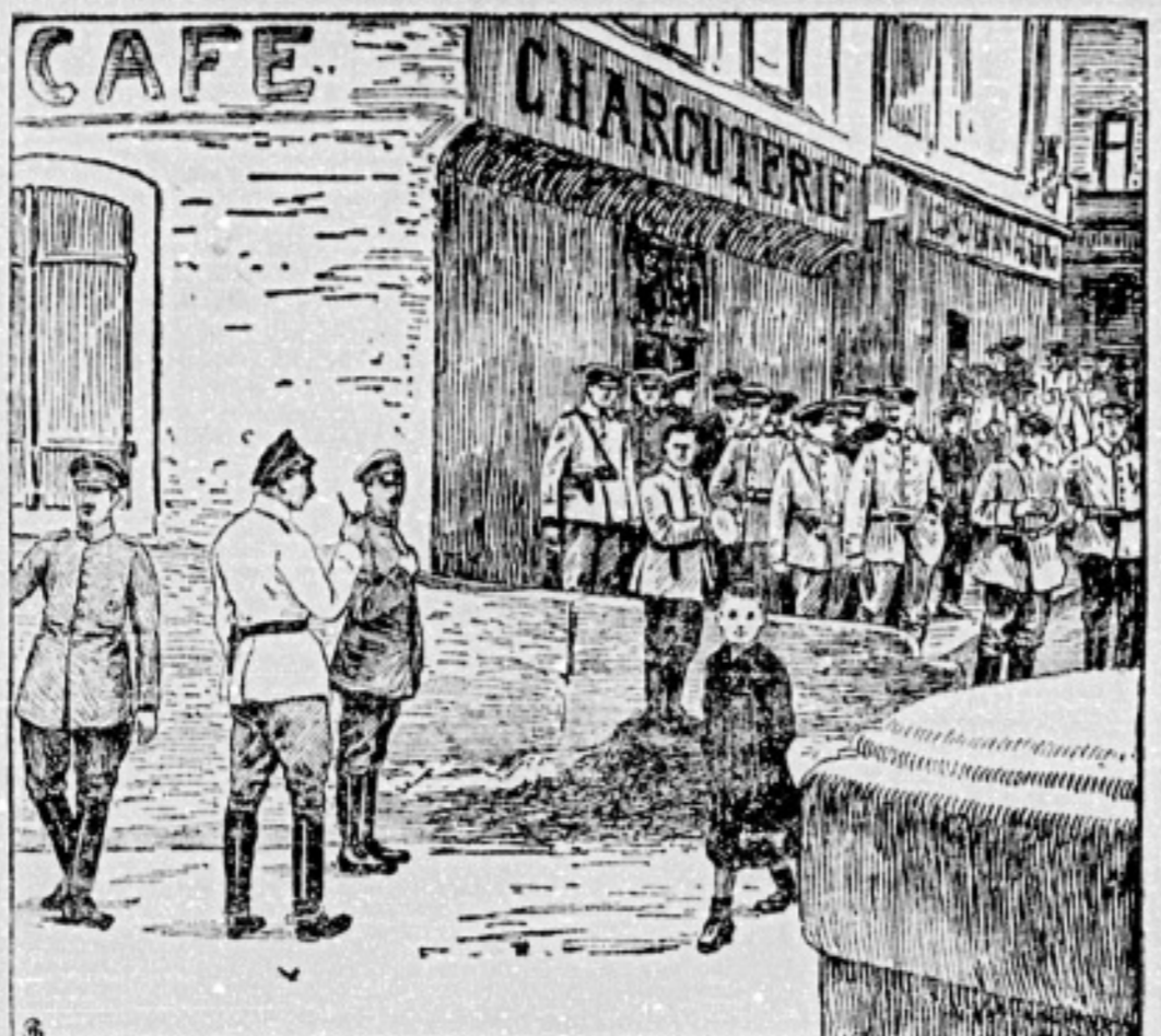
Der deutsche Kronprinz im Felde. Vom westlichen Kriegsschauplatz.

Der deutsche Kronprinz im Felde. Vom westlichen Kriegsschauplatz. (Fortsetzung)