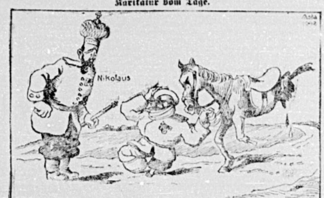
Ein Hindenburgs Arbeiter: Klug, Überes der bei Tannenberg geschlagenen Narwe-Narwe