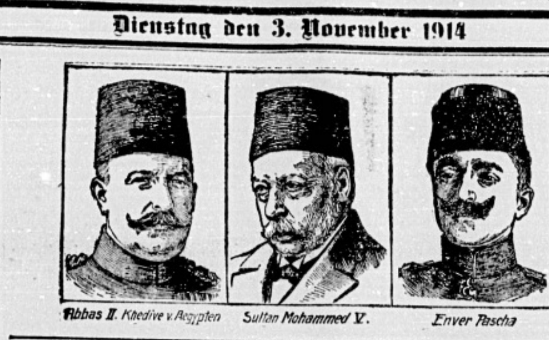
Abbas II. Khedive von Ägypten, Sultan Mohammed V., Enver Pascha.

Amtsblatt für die Bekanntmachungen sämtlicher Behörden des Kreises und der Stadt Worms. Amtsblatt für die Bekanntmachungen sämtlicher Behörden des Kreises und der Stadt Worms.