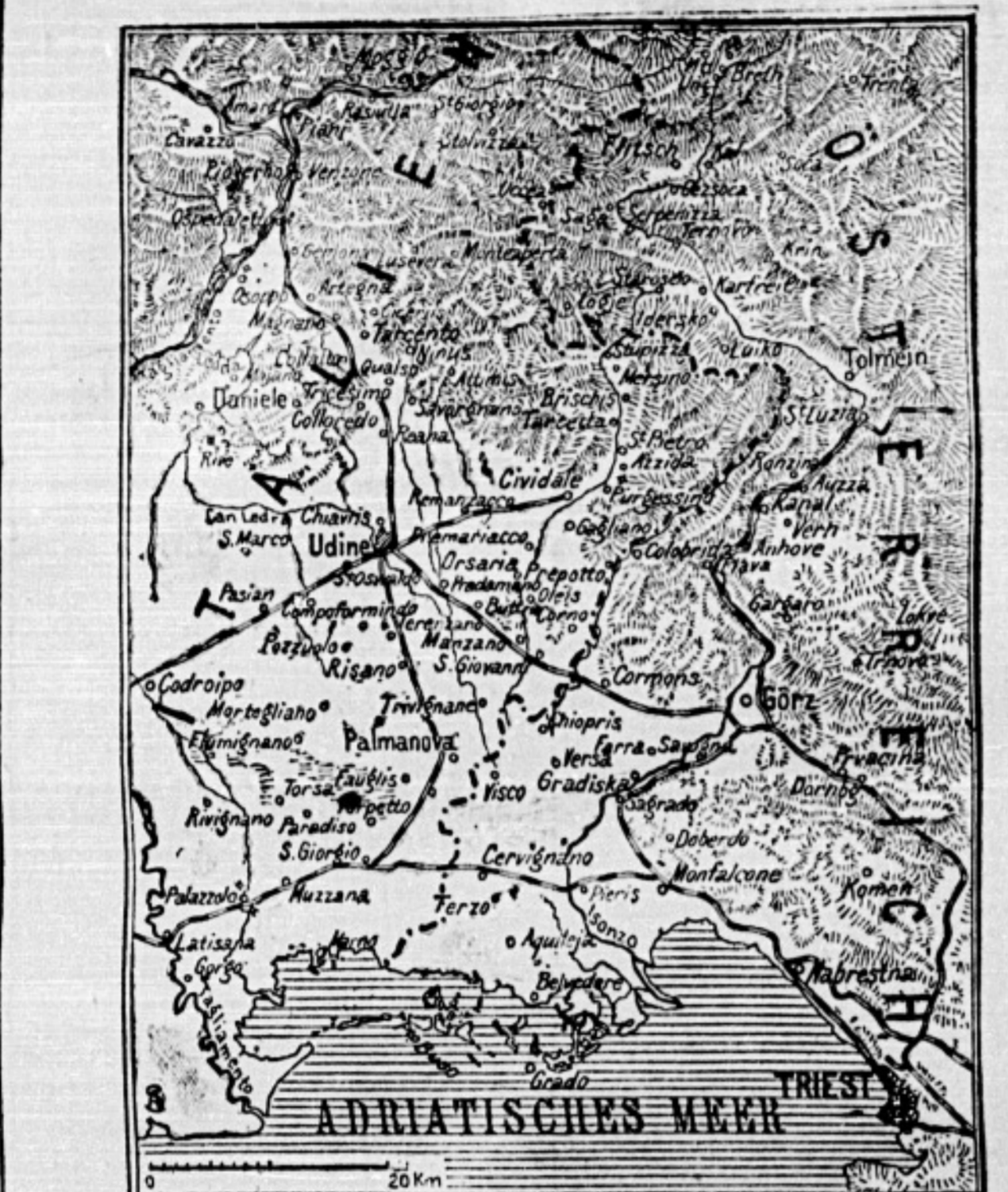
Die in den Römischen Mittelmeer-Italienischen Küstengebiet.