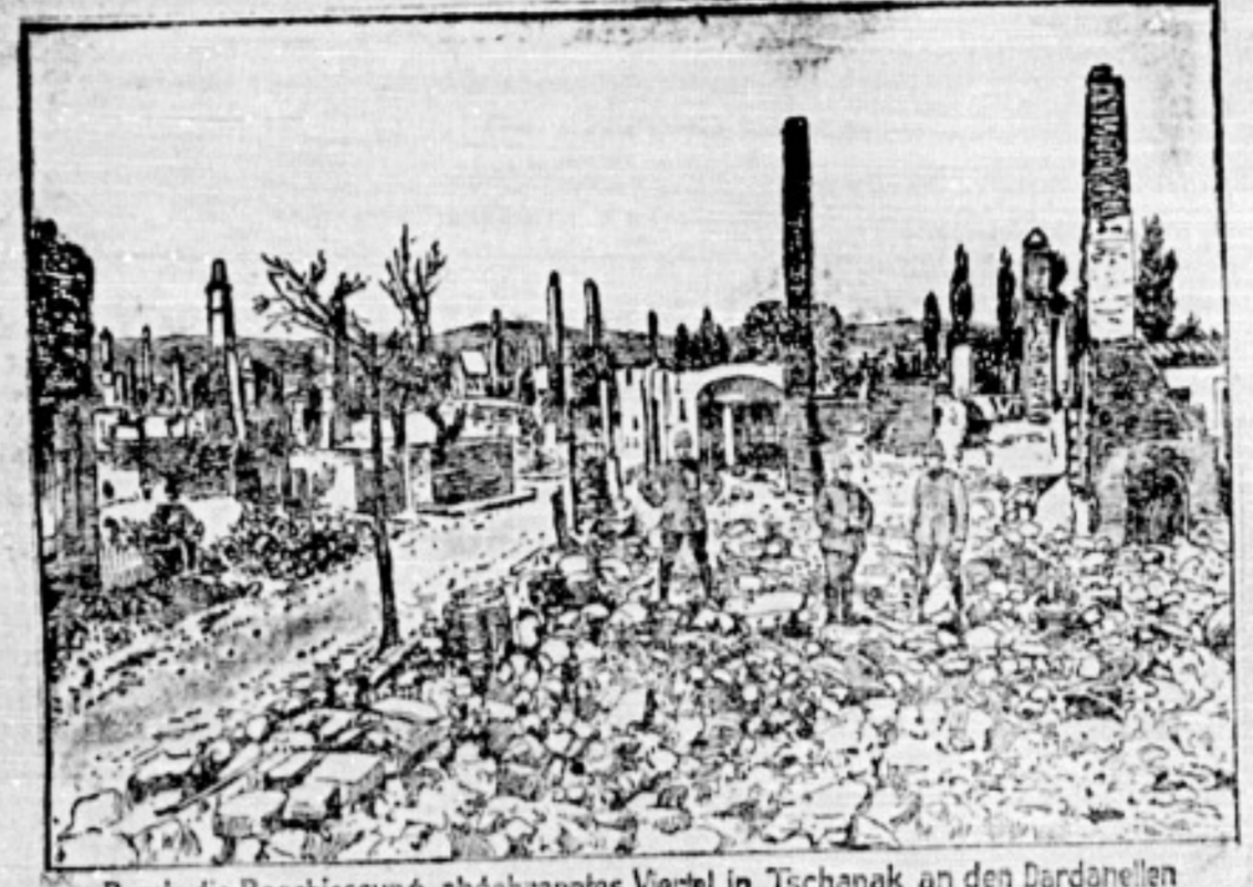
Durch die Beschussung abgebranntes Viertel in Tschank an den Dardanellen

Wormer Zeitung Wormer Zeitung Wormer Zeitung