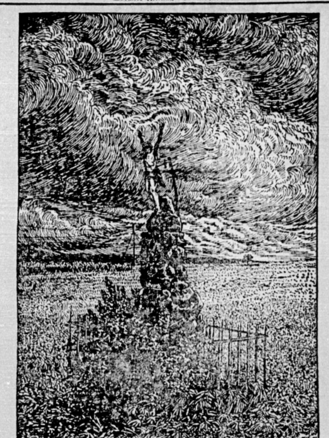
Ein Brief aus... Ein Brief aus... Ein Brief aus...