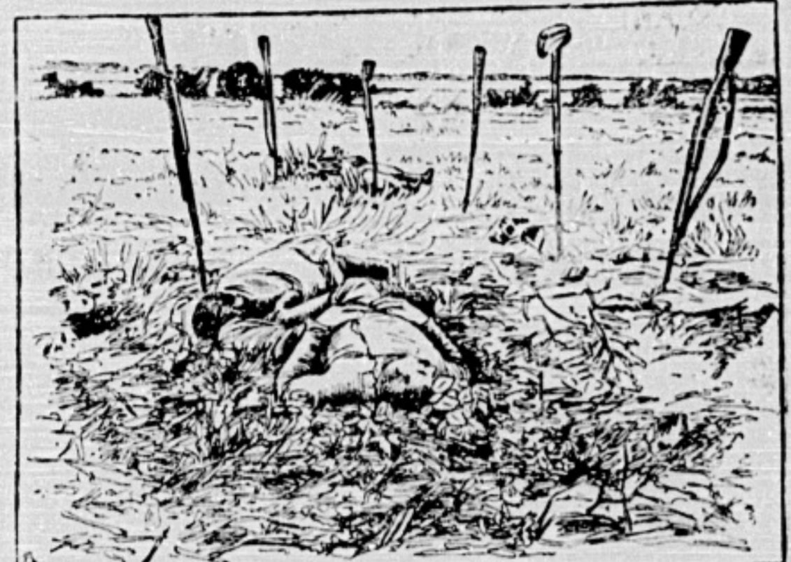
Ein Schützengraben bei einem Kampf.