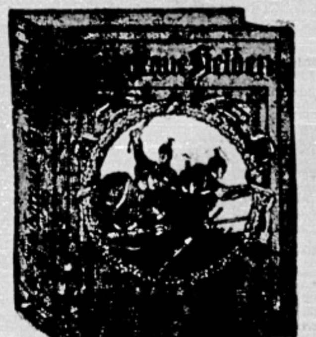
Das Bild, dessen Formel II auf II, auf dem Kasten...

besieht in einem neuartigen illustrierten Original-Prachtwerk unter dem Titel