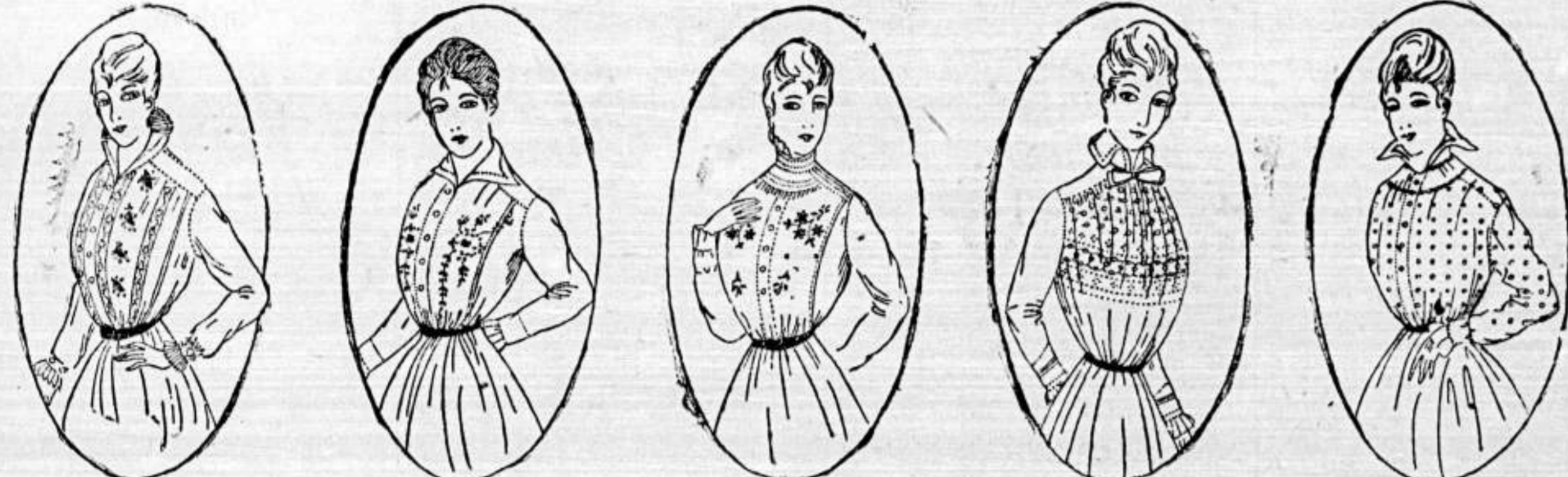
„Tilly“ Basist-Bluse, aus bestick. Vell., mit schönen Spitzenmalen, Hobausverzierung u. mod. plisierter Kragen aus Glasst. Mk. 3.70 „Lydia“ Bluse, aus gutem Vell. mit schönem Stah- Umlegekrag., reichbestickten u. mit Hobausmalen durchgezogenen Vorderkrag. Mk. 5.95 „Helen“ Elegante Vell.-Bluse, erstklassig verarbeitet mit imitierten Fitt-Einstichen und opaker Stechern. Mk. 12.95 „Lucia“ Vell.-Bluse, hochmodern mit schön durchmaltem Querschnitt aus miltelaltenen Webungen aus. vom 4. August 1914 (Preis-Gesetzl. S. 277) folgende Verordnung erlassen: „Gerta“ Schön gestap. Vell.-Bluse mit räumigen Koller, modernem Stahkragen und Einstichen garniert. Mk. 6.95