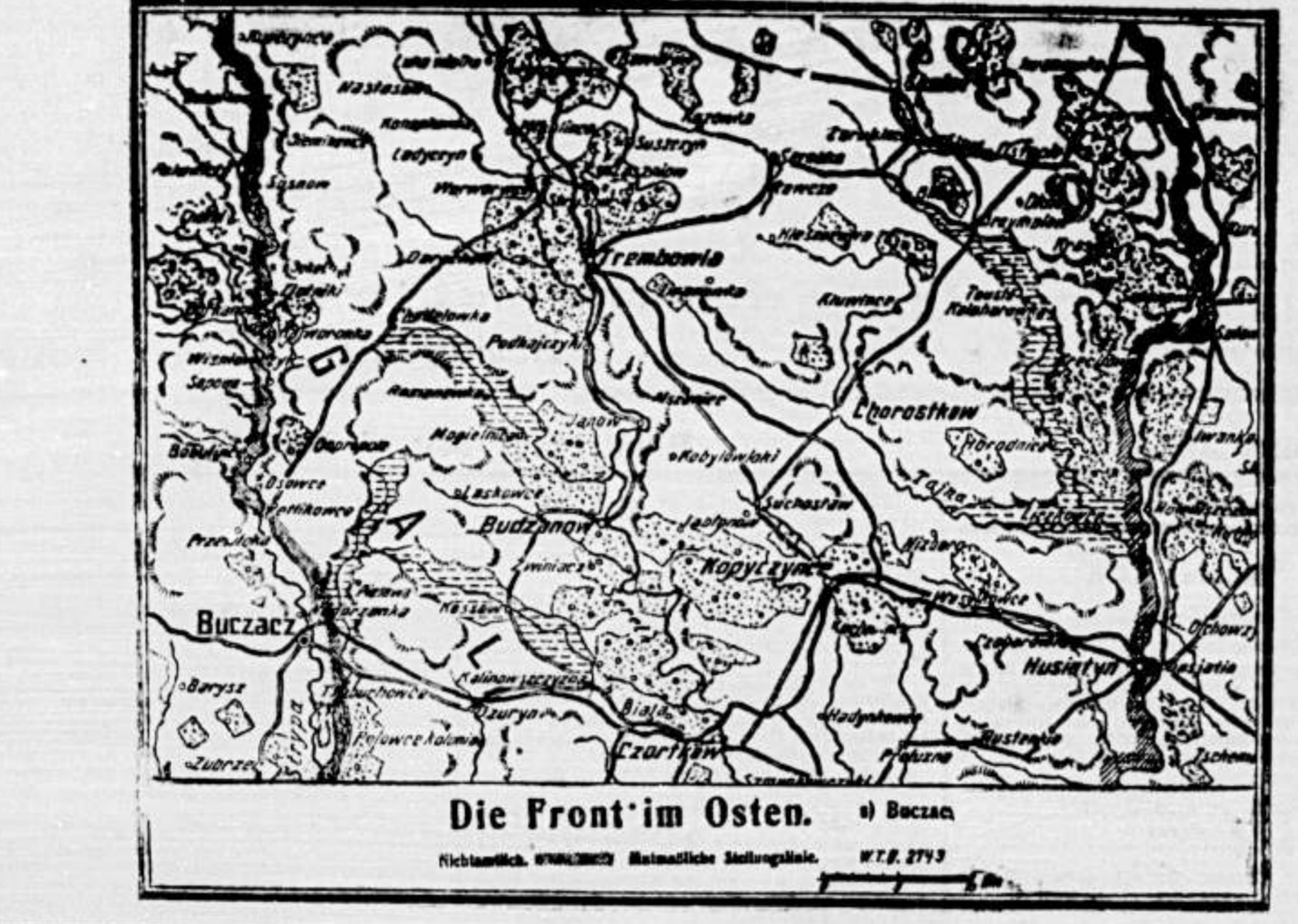
Die Front im Osten. (a) Buczacz. Die deutsche Regierung hat sich für die Entschärfung der Lage für die Fronten bei Verdun entschieden.

Zu den Beschlüssen der Konferenz von St. Germain hat die deutsche Regierung sich für die Entschärfung der Lage für die Fronten bei Verdun entschieden. Die deutsche Regierung hat sich für die Entschärfung der Lage für die Fronten bei Verdun entschieden.