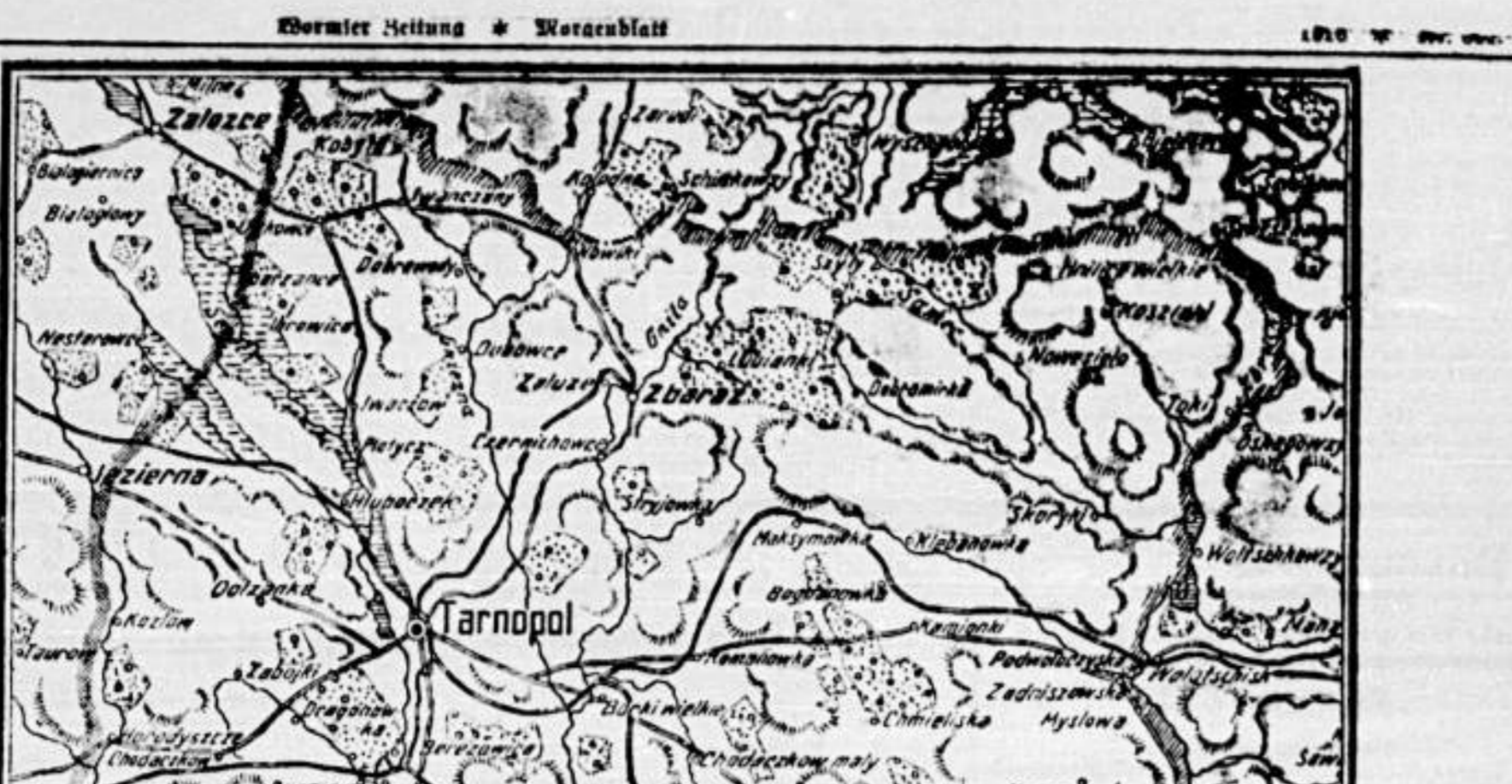
Die Front im Osten. Militärische Situation in Ostpolen.

Die Meereslange. Die Meereslange ist ein riesiges Meerestier, das sich über 100 Meilen lang erstreckt.