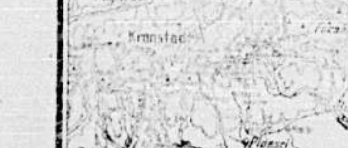
Die militärische Lage in Rumänien.