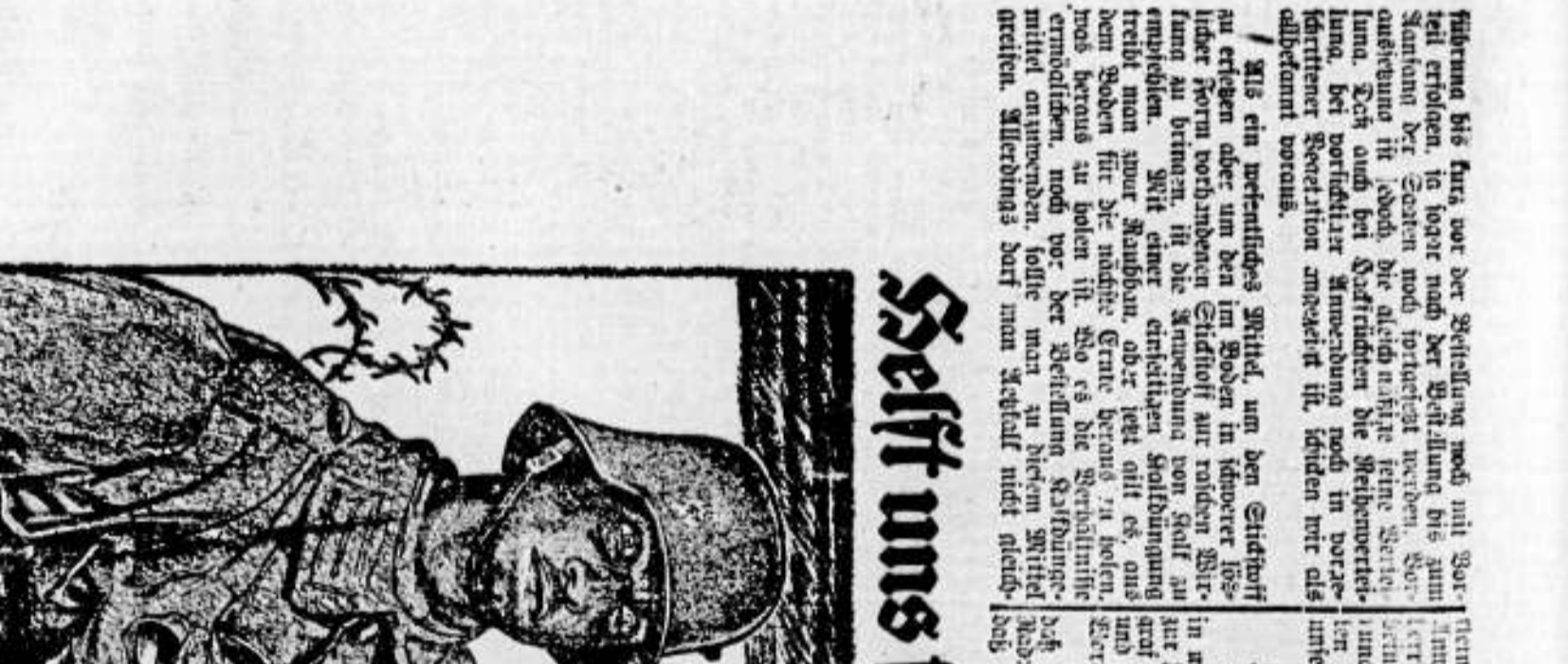
Reicht uns liegen! Reichsanwaltschaftsrechtsänderung.

Textual content related to the Reich Chancellor and the ongoing legislative process.