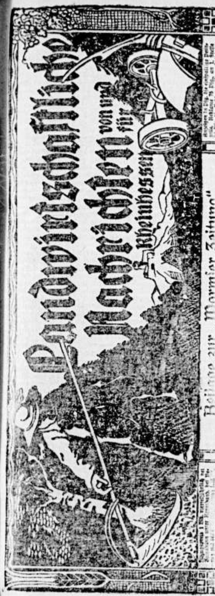
Belag zur 10. Provinzial-Tagung Freitag, 19. Juli 1918