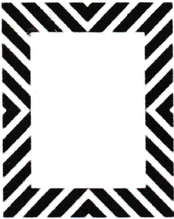
↑ biometrisches Lichtbild ↑