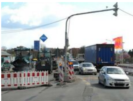
„B9 Knoten am Gallborn; Foto: Wormser Zeitung“