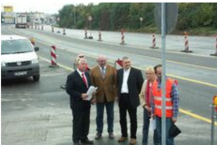
Mitte Oktober sollen alle Baumaßnahmen abgeschlossen sein